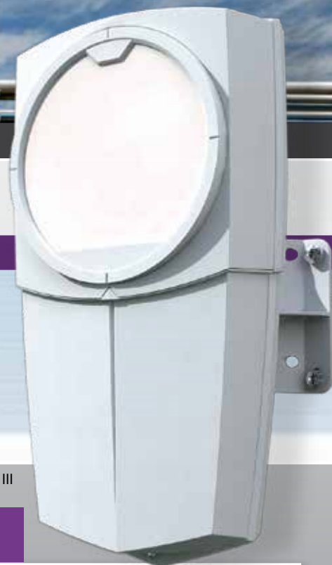
Kapiris II & III